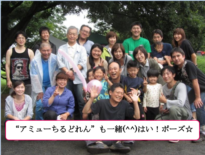
“アミューちるどれん”も一緒(^^)はい!ポーズ☆