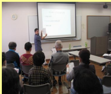
↑介護者様対象のセミナー ↑社協主催の健康予防セミナー 筋肉や疲労蓄積の説明等、座学もあります。