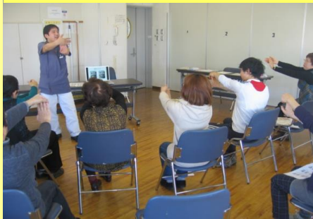
↑地域サロンにて 皆様と一緒にストレッチ中!!!