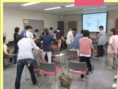
↑ヘルパー事業所研修にて ↑社協主催の健康セミナー もちろん、指圧のコツもご伝授致します (*^_^*)