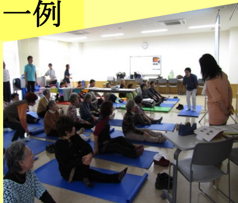
↑地域包括の健康セミナー マットを準備していただきました。

小規模でのセミナーもご相談ください。ご要望にそったセミナーをいたします。オーダーメイドのセミナー、ぜひご活用ください。